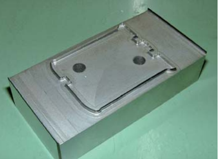
一体形トムソン型